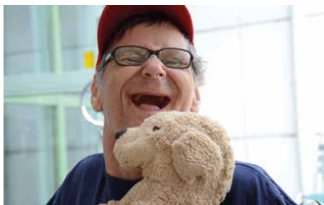
Stig på Lugnt på Lehmiranta.