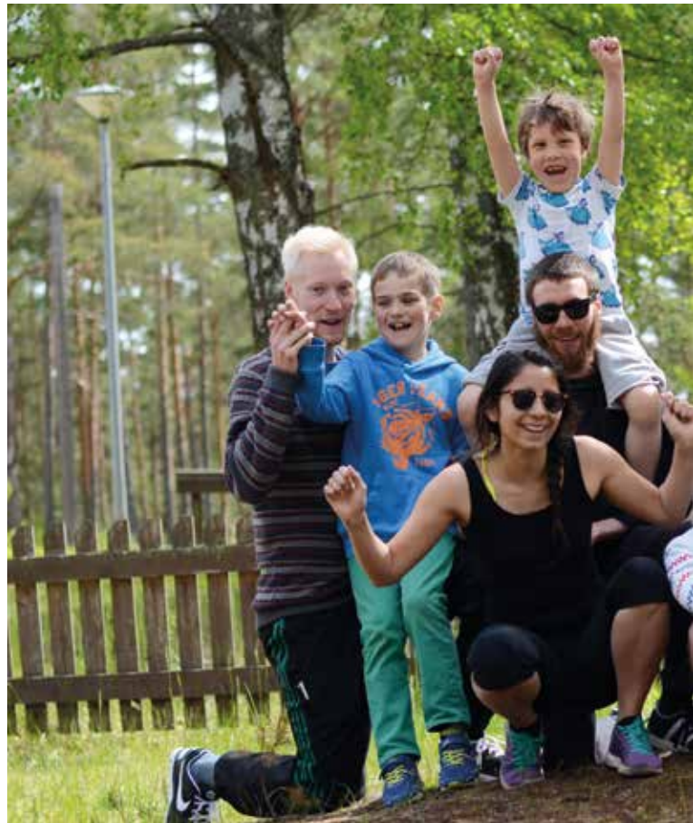
Hela lägergänget på Sommarskoj på Högsand i juni.

Lägerbroschyren för sommaren 2015 publiceras i GP nummer 1/2016.