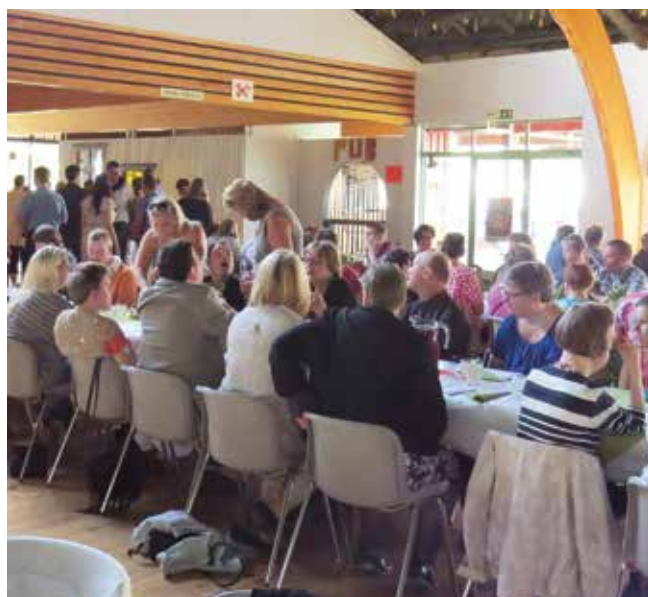
Festen med medlemmar från både DUV i Vasanejden och Sydösterbotten inleddes med en middagsbuffé.