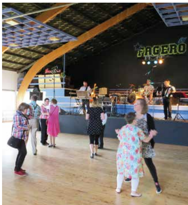
Dans till tonerna av TreskAllan and the Gastronoms på sommarfesten på Fagerö.

Kom med på soppdag och basar söndagen den 1 november på Evangeliska Folkhögskolan i Vasa. Soppan serveras mellan klockan 11.30 och 14.00. Produkter från Hantverket finns till salu.