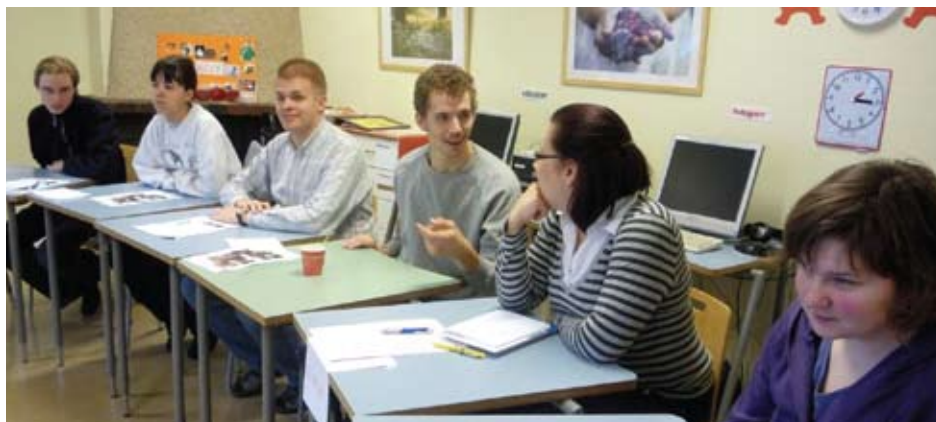
Kurs för arbetstagare på Practicum i Borgå hösten 2009.

Sammanlagt har ca 60 arbetstagare deltagit i kurserna.