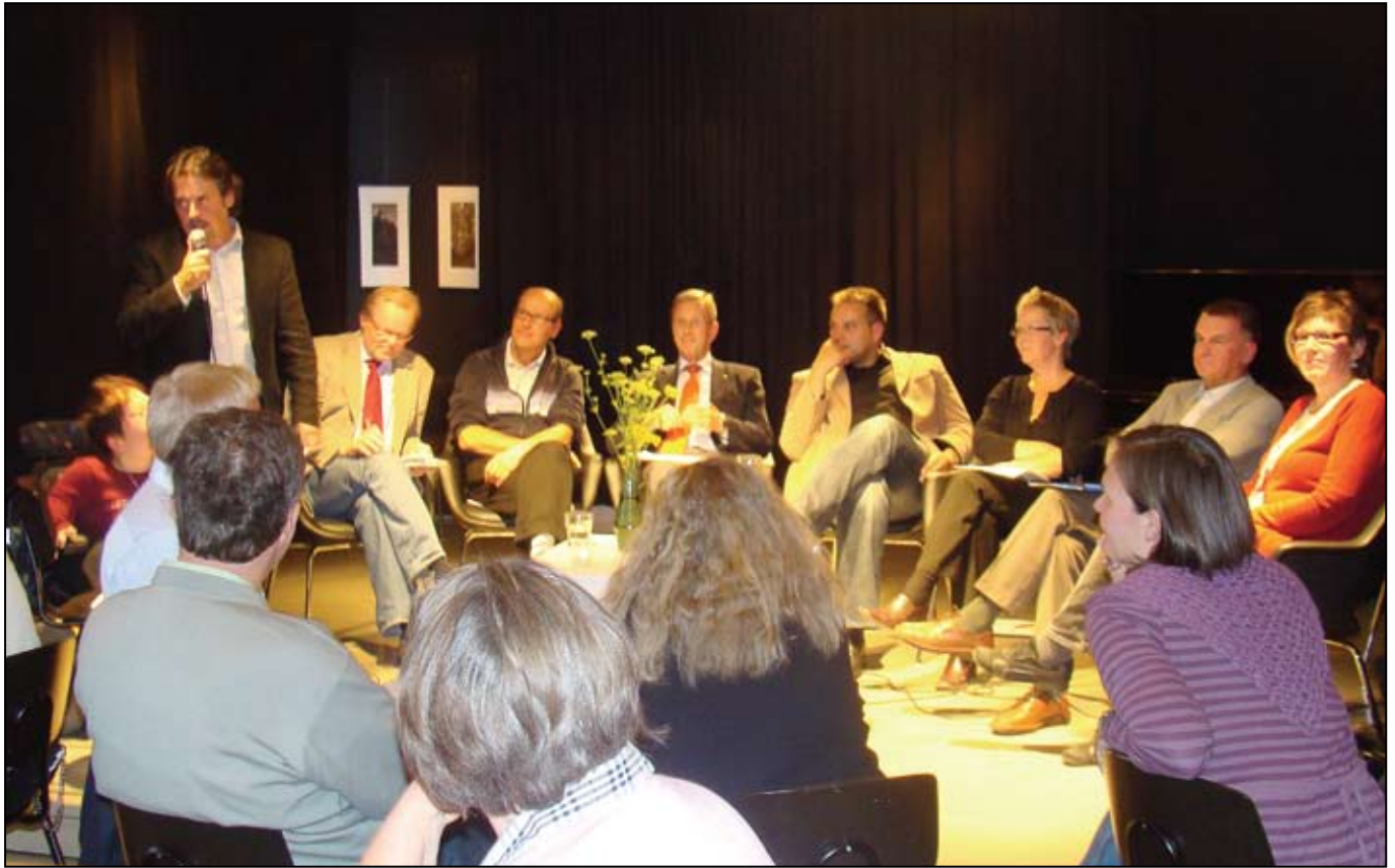
Panelen i rundabordsdiskussionen i Jakobstad den 16 september 2008.